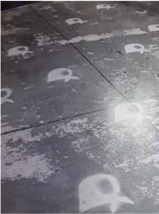
ELIGIENDO EL NOMBRE DEL JARDÍN