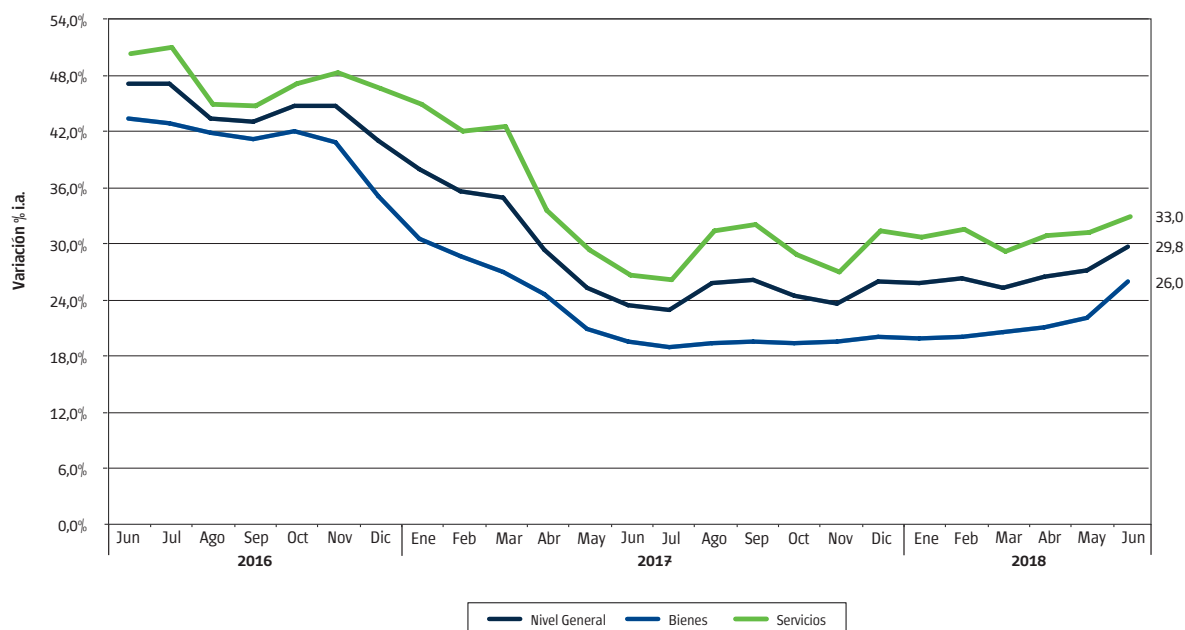
Gráfico 1 IPCBA. Trayectoria interanual. Nivel General, Bienes y Servicios. Junio de 2016/junio de 2018