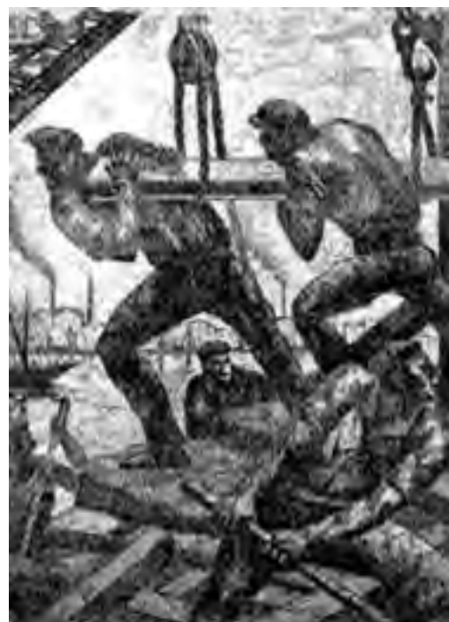
Benito Quinquela Martín

En nuestro país el 1º de mayo es feriado nacional por la Ley 21.329 de Feriados Nacionales y Días no Laborables