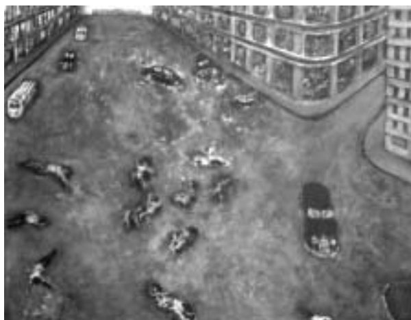
de Eduardo Maradei: "Preludio"

Pero además, constituye una referencia elocuente del rechazo de una clase social poderosa a todo lo que representara la cultura popular o nacional; los "cabecitas negras", "los grasas", y las diversas clasificaciones creadas para desdeñar a los trabajadores, los migrantes (del interior del país) y los gobiernos que los intentaran representar; junto con la necesidad constante de mirarse en espejos europeos de clases altas, contra las propias corrientes inmigrantes y migrantes que formaban parte de ese pueblo trabajador -con sus tradiciones políticas, anarquistas, socialistas y comunistas, en el S XIX y comienzos del XX, y peronista -mediados del SXX-. Este rechazo deseaba amputar esa generación cultural novedosa -mezcla del aporte de los diversos pueblos-, en el marco de un contexto profundamente latinoamericano.