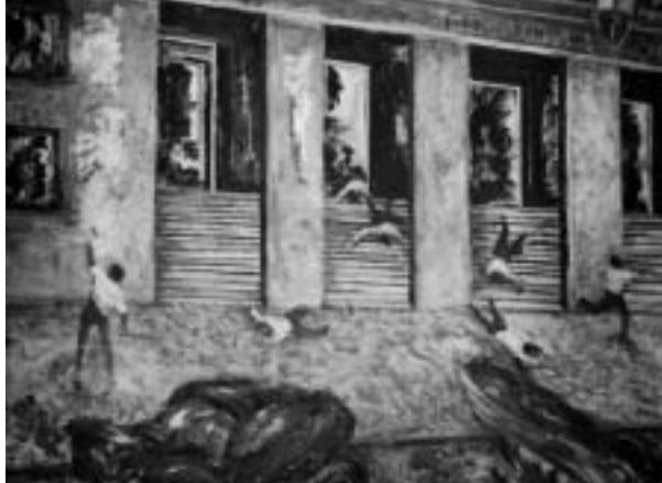
de Eduardo Maradei: "De eso no se habla"