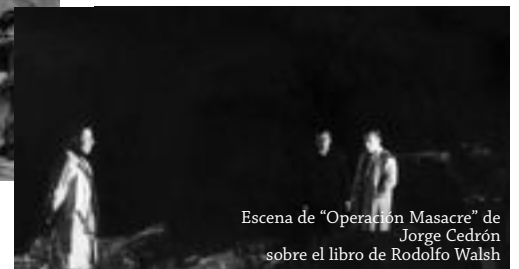
Escena de "Operación Masacre" de Jorge Cedrón sobre el libro de Rodolfo Walsh