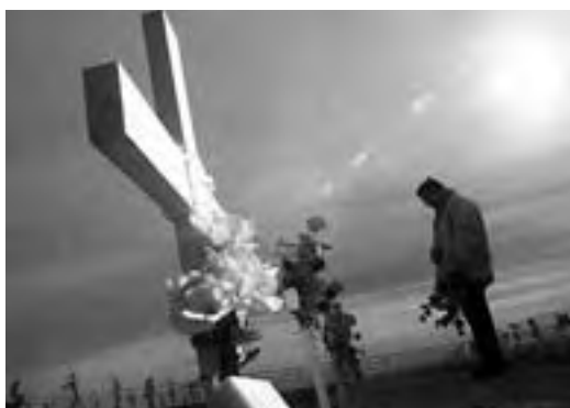
Cementerio donde están enterrados soldados argentinos en las Islas Malvinas

submarino atacó con torpedos si preaviso. La cifra de fallecidos ascendió a casi 370 hombres. Es importante señalar que el ataque fue repudiado por la mayoría de los organismos internacionales y también por el propio parlamento inglés. Durante la guerra la mayoría de los países Latinoamericanos se unieron solidariamente en defensa de la soberanía argentina y en contra del imperialismo inglés. Entre el 9 y el 15 de mayo las fuerzas inglesas bombardearon Puerto Argentino y Puerto Darwin. Las tropas argentinas hundieron el destructor inglés Sheffield, la Fragata Coventry, los barcos Sir Galaliard y Sir Tristán. El 9 de junio se produjeron intensos combates en la zona de Puerto Argentino. La derrota argentina comenzó a ser evidente. Los datos reales de los combates eran ocultados por la dictadura que por los medios proclamaban que “estábamos ganando”. El 11 de junio, el Papa llegó a la Argentina, el 14, el Gral Menéndez se rindió oficialmente ante el Gral inglés Brit Moore. El conflicto duró setenta y tres días. Nunca se supo con exactitud el número de argentinos muertos en las islas.