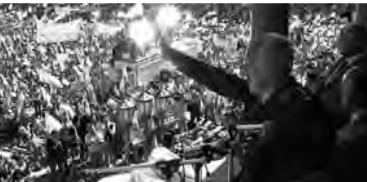
Leopoldo Fortunato Galtieri en Plaza de Mayo cuando anunció la recuperación de las Islas Malvinas. 2/04/82.