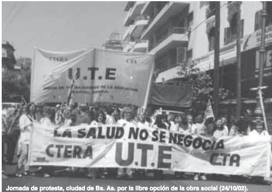
Jornada de protesta, ciudad de Bs. As. por la libre opción de la obra social (24/10/02).