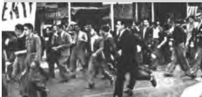
Raúl Scalabrini Ortiz

rostros atezados, brazos membrudos, torsos fornidos, con las greñas al aire y las vestiduras escasas cubiertas de pringues, de restos de brea, grasas y aceites. Llegaban cantando y vociferando, unidos en la imprecación de un solo nombre: ¡Perón!. (...) Era el subsuelo de la patria sublevado. Era el cimiento básico de la Nación que asomaba por primera vez en su tosca desnudez original, como asoman las épocas pretéritas de la tierra en la conmoción del terremoto. Era el substrato de nuestra idiosincracia y de nuestras posibilidades colectivas allí presente, en su primordialidad sin recatos y sin disimulos..... Presentía que la historia estaba pasando junto a nosotros y nos acariciaba suavemente como la brisa fresca del río ...Por inusitado ensalmo, junto a mí, yo mismo dentro, encarnado en una muchedumbre clamorosa de varios cientos de miles de almas conglomeradas en un solo ser unívoco, aislado en sí mismo, rodeado por la animadversión de los soberbios de la fortuna, del poder y del saber, enriquecido por las delegaciones impalpables del trabajo de las selvas, de los cañaverales y de las praderas... traduciendo en la firme línea de su voz conjunta su voluntad de grandeza, consumiendo en la misma llama los consancios y los desalientos personales, el espíritu de la tierra se erguía vibrando sobre la plaza de nuestras libertades, pleno en la confirmación de su existencia.